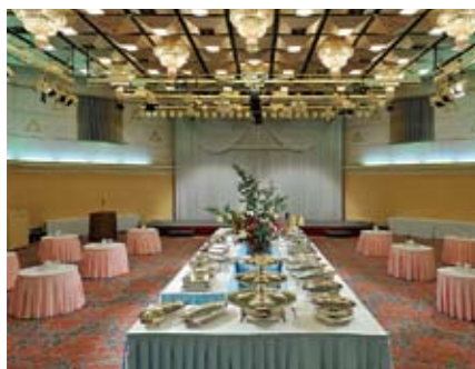
1F ハーモニーホール