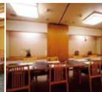
華蓮 / 4~8名様