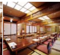
お座敷 / 45名様迄