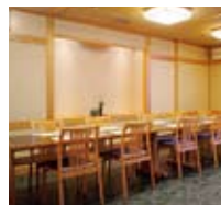
楓 / 6~12名様