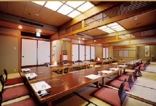
3F 銀杏 (座敷)