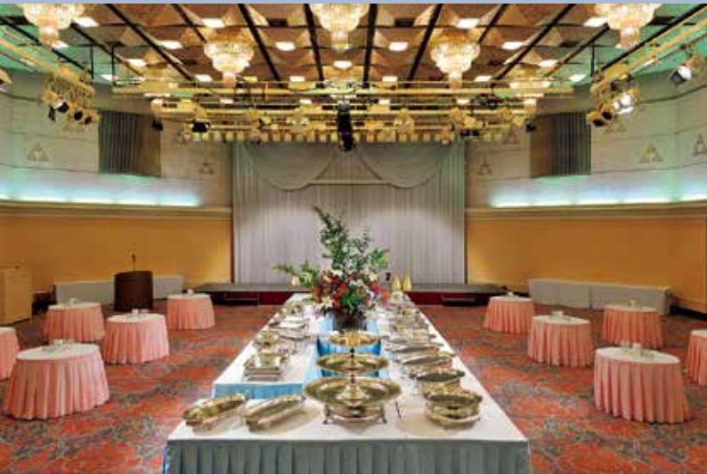
1F ハーモニーホール