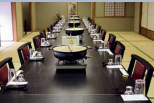
3F 和室 (イス・テーブル席)