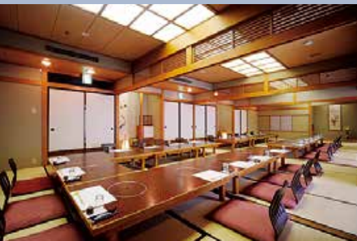
3F 銀杏 (座敷)