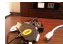
全室に携帯充電器

仕事は勿論、読書しても気にならない明るさ。明るい室内で快適ホテルライフをお約束。