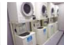
コインランドリー・乾燥機