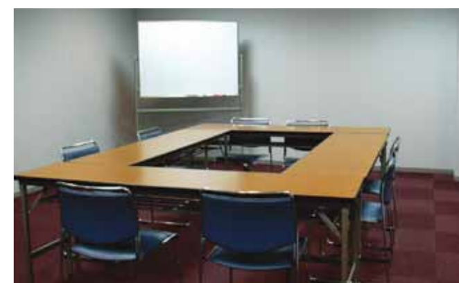
ライラックルーム (5F)