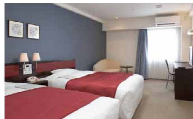
デラックスツインルーム