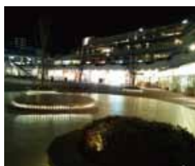
テラスモール湘南

JR辻堂駅北口直結の立地に加え、東京ドーム3.6個分の敷地に湘南初進出店やシネコンを含む281店舗が集う、地域最大級の大型ショッピングモール。