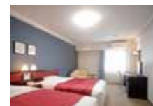
シーリングライト採用

仕事は勿論、読書しても気にならない明るさ。明るい室内で快適ホテルライフをお約束。