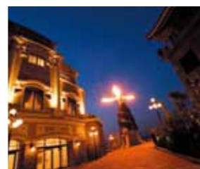
江の島アイランドスパ

奈良東大寺の大仏、富山県高岡の大仏とともに三大大仏といわれている。像高約11.3m。鎌倉で唯一の国宝仏。