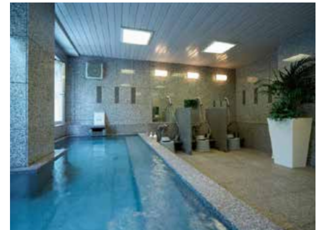
思いっきり手足を伸ばして、一日の疲れを癒してくれる大浴場

「ホテル法華イン東京八丁堀」はJR・地下鉄線の八丁堀駅から 「徒歩約1分」の好アクセス。